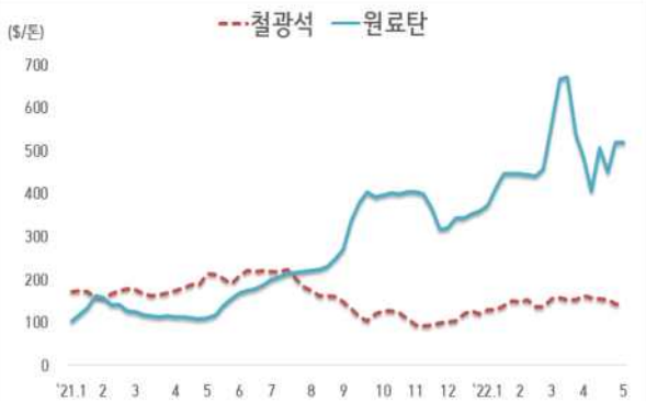
< 철광석/원료탄 가격 동향 >