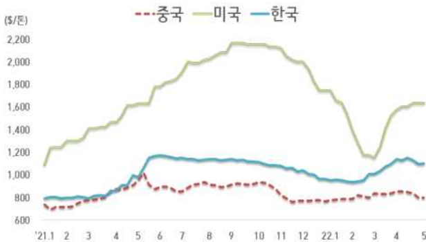
< 국내외 열연강판 내수가격 동향 >