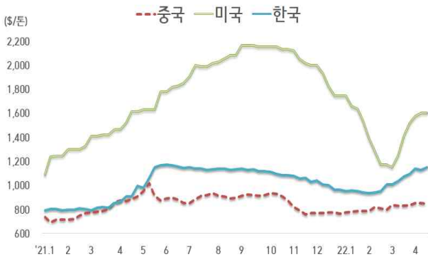
< 국내외 열연강판 내수가격 동향 >