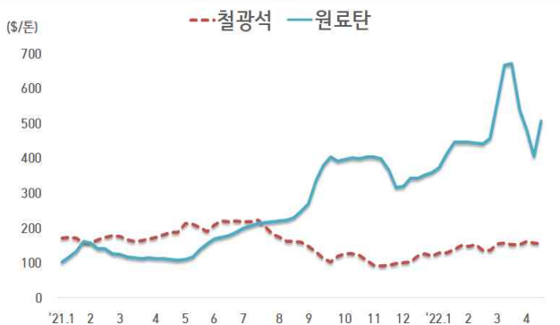
< 철광석/원료탄 가격 동향 >