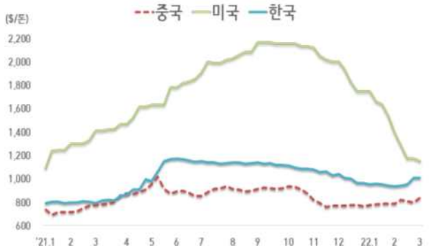
< 국내외 열연강판 내수가격 동향 >