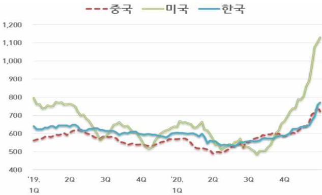
【국내외 열연강판 내수가격 동향】