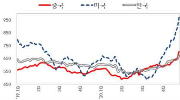
【국내외 열연강판 내수가격 동향】