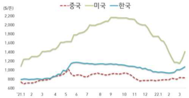
< 국내외 열연강판 내수가격 동향 >