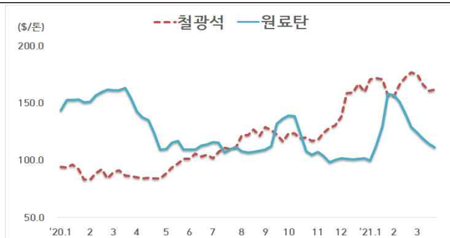
< 철광석/원료탄 가격 동향 >